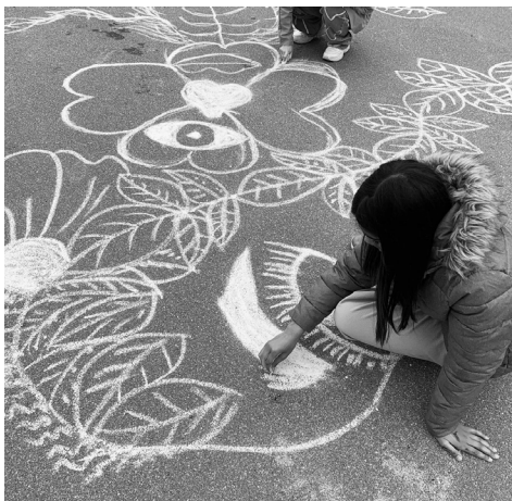
WORKSHOP MED SKIVE BIBLIOTEK : VANDREHISTORIER MED BOGBUSSEN NÅR FORTÆLLING OG FANTASI FOLDER SIG UD