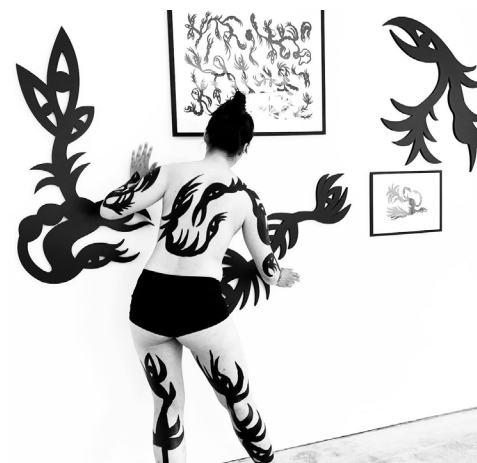
UDSTILLING : SE! UDSILLINGS -& PROJEKTRUM