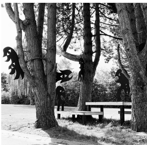
PUBLIC ART INSTALLATION PÅ FÆNGSLET THE MONSTERS