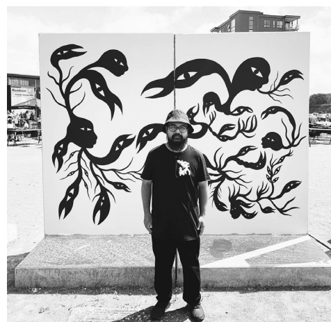
STREET ART FESTIVAL I BRANDE THE TRANSFORMATION OF SNAKES