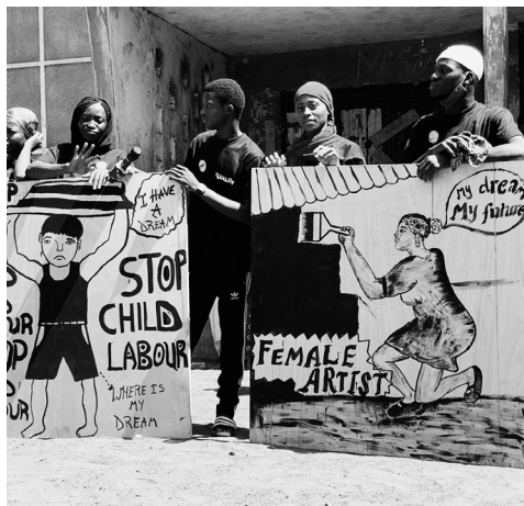
WORKSHOP IN TAMALE // NORTH GHANA COLLAB. WITH NGO GHANAVERSKAB ORG