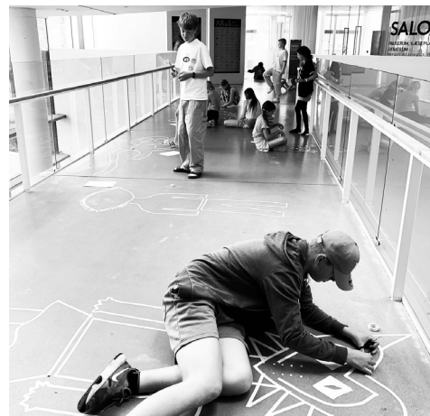
WORKSHOP PÅ AROS MUSEUM : SOMMER KUNST SKOLE STREET ART MED STORYTELLING // TAPE STREET ART